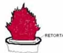
a. Płomień właściwy