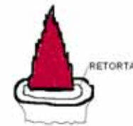
b. Płomień niewłaściwy